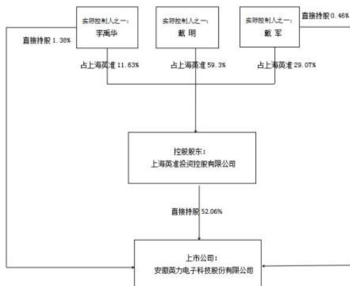
公司与实控人之间产权及控制关系的方框图